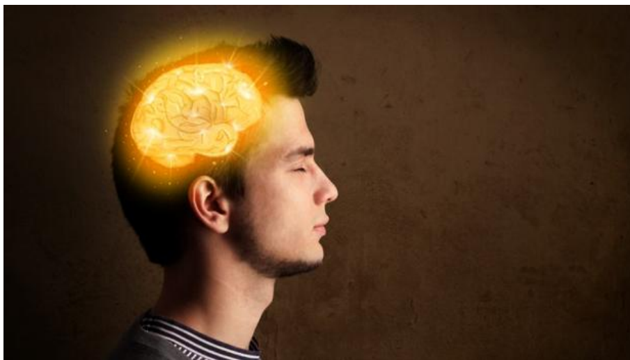
Más del 50% de los jóvenes con altas capacidades no finalizan los estudios superiores - ABC

GEMA NAVARRO / - @abceconomía Madrid 17/01/2017 01:58h - Actualizado: 17/01/2017 01:59h. Guardado en: Economía